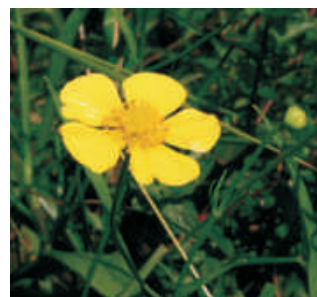
pryskyřník velký ( Ranunculus lingua )

Chropynský rybník odedávna přitahoval nejen místní botaniky svou bohatou květenou. Ještě v 60. letech 20. století se zde vyskytovalo velké množství chráněných vodních a mokřadních druhů rostlin, např. kriticky ohrožený leknín bílý ( Nymphaea alba ), pryskyřník velký ( Ranunculus lingua ) nebo vodánka žabí ( Hydrocharis morsus-ranae ).