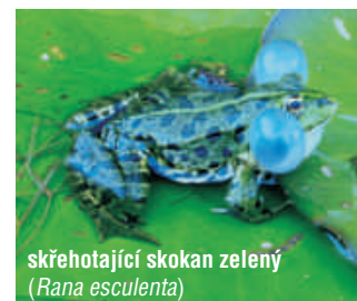
skřehotající skokan zelený ( Rana esculenta )

Každá obec má svou dlouhou historii a ani Chropyně není výjimkou. Archeologické nálezy potvrzují existenci osady již kolem roku 1000, v roce 1535 byla ves povýšena Ferdinandem I. na městečko a roku 1970 byl Chropyni udělen statut města. K historii Chropyně neodmyslitelně patří i hanácký král Ječmínek, symbol dobra a spravedlnosti, který se podle pověsti má objevit, až bude lidu nejhůře. Minulost města Vás tedy provede čtvrtá tabule naučné stezky.