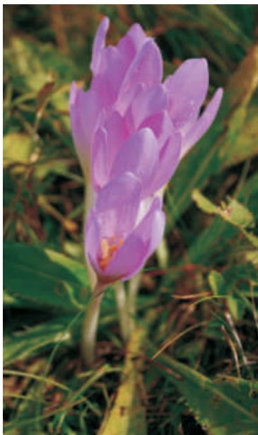
ocún jesenní ( Colchicum autumnale )