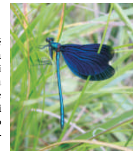
motýlice obecná ( Calopteryx virgo )

Najít v naší novodobé kulturní krajině vodní tok, který ještě lidská ruka neuvěznila mezi rovné břehy či nespoutala do betonového koryta není zrovna lehké. Malá Bečva se však stále ještě může pyšnit svými meandry a líné tekoucí vodou. Do tajů světa nejen pod její vodní hladinou se můžete ponořit u šesté tabule.