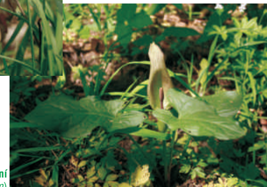
áron východní ( Arum cylindraceum )