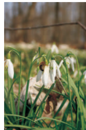
sněžěnka podsněžník ( Galanthus nivalis )

Že není les jako les mi dá jistě každý z Vás za pravdu. A u lužního lesa to platí dvojnásob. Ale co to vlastně lužní lesy jsou a jaké záhady ukrývají? Čím jsou tak zvláštní, zajímavé a důležité? Na tyto a mnoho dalších otázek Vám odpoví sedmá tabule.