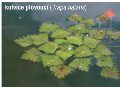
kotvice plovoucí ( Trapa natans )

První zmínky o chropynském rybníku se datují do 13. století, kdy byl rybník součástí vodní tvrze. V roce 1928 byl vyhlášen chráněným územím především k ochraně hnízdní kolonie racka chechtavého ( Larus ridibundus ) a výskytu kriticky ohrožené kotvice plovoucí ( Trapa natans ). Že nevíte, co to kotvice je? Nevadí, tady se to určitě dozvíte.