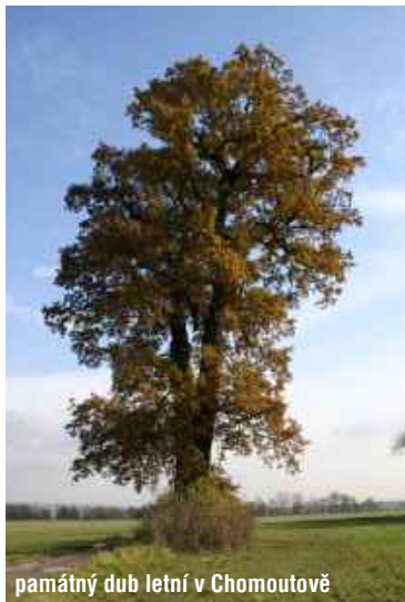
památný dub letní v Chomoutově

Možná že po těch všech travách, ptáčích a hmyzu budete trochu unaveni a v hlavě z toho nebudete mít moc jasno. Nezoufejte. Změna je život a proto právě desáté zastavení se věnuje opět troše historie. Tentokrát je to ryze venkovská záležitost, a proto pokud toužíte vědět, jak to v Chomoutově vypadalo téměř před tisícem let, neváhejte a začtěte se do textu, který vás u desátého zastavení stručně provede historií obce od jejího založení (první zmínka 1078 Chomoutowitzi) po současnost.