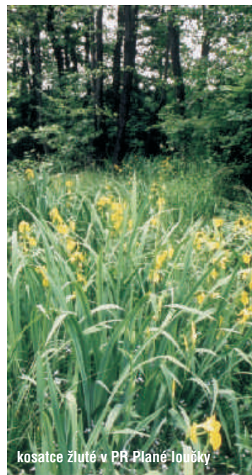
kosatce žluté v PR Plané loučky

U tohoto zastavení se dozvíte základní informace o tomto mokřadním skvostu nejen v okolí Olomouce a střední Moravy, nýbrž svým významem - i mezinárodním, chráněném v rámci Ramsarské úmluvy. Budete určitě překvapeni druhovou bohatostí jak rostlin tak živočichů, kteří zde mají svůj domov. Již ne tak zajímavé, ale zajisté taktéž poučné budou vaše nabyté informace o rozloze a roce založení rezervace. Pokud se Vám bude zdát toto zastavení poněkud „nudné a chudé“ nezapomínejte a vykročte dál, to hlavní z mokřadního klenotu jménem Plané loučky Vás teprve čeká.