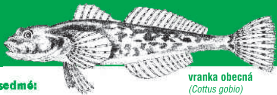
vranka obecná ( Cottus gobio )