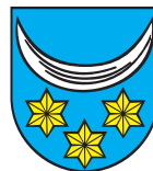
erb velkobystřického panství

První písemné zprávy o hradu Hluboký jsou známé z roku 1351, kdy ho zdědil Karel IV. Nejvýznamnějším aktem v historii hradu byla schůzka roku 1425 mezi husitskými hejtmány a přáteli opavského vévody Přemka. Jejím výsledkem byl přechod mocných moravských feudálů do husitského tábora.