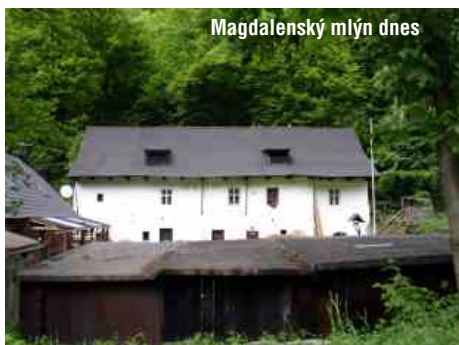
Magdalenský mlýn dnes

Údolí řeky Bystřice a jeho široké okolí bylo od pradávna hospodářsky poměrně hodně využíváno. Charakteristickým rysem byla těžba kvalitních břidlic. Dodnes zde můžete narazit na řadu již opuštěných lokálních lůmků, či na dosud funkční velké lomy. Další významné aktivity byly a jsou: těžba kvalitního dřeva, těžba barevných kovů, či výroba piva. Významnou roli sehráli v minulosti taktéž mlýny na řece, které fungovaly buďto jako pily ke zpracování vytěženého dřeva, nebo jako mlýny k semletí obilí.