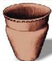
keramika kultury nálepkovitých pohárů

Z první poloviny 1. tisíciletí př.n.l., jsou zde zbytky čtvrté linie opevnění a keramiky zdobené geometrickými ornamenty po kultuře lidí popelnicových polí.