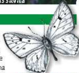
ohniváček modrolesklý Lycaena alciphron

Za slunných letních dnů zde spolu s bačkami, okáči a dalšími běžnými motýly létá několik vzácných druhů modrásků a ohniváčků, zejména modrásek bahenní a ohniváček modrolesklý.