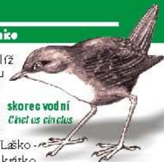
skorec vodní Cinclus cinclus

Povodí Šumice je obzvláště mýty odlesněné a zemědělsky využívané, o čemž svědčí hnědý zákal vody po každém větším dešti a vrstva hlinitých usazenin v korytě. Přesto je to voda živá, kde na spodní straně břidlicových oblázků najdete pestré společenstvo vodních živočichů, různých koryšů a lare vjevic, pošvatek a chrostků. Na ně je vázán výskyt ryb pstruhového pásma, například pstruha potůčnického a mřenky mramorované, a vodních ptáků skorce vodního, koripasa horské a ledňáčka říčního.