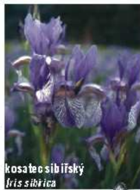
kosatec sibiřský Iris sibirica

Mokřadem je v první řadě říčka Šumice. Další mokřady se nacházejí v její nivě. V nivách se v přirozených podmínkách vytvářejí porosty olše plavé - olšiny. V podrostu dleš se vyskytují vlhkomilné rostliny jako potůčnická vzpřímená nebo řeišnice hoiká. Olšiny dnes v Terezkém údolí rostou především na úpatí svahů, kde vyvěrají četné prameny. Na místech vykáčených dleš vzniká ostřicový mokřad s výskytem světlomilných bahenních rostlin. V Terezkém údolí na těchto stanovištích rostou například ostřice trsnatá, skřípina lesní, blatouch bahenní a pcháč potůční. Zvláštní skupinou mokřadů jsou prameny. Většina pramenů v Terezkém údolí vyvěrá na úpatí svahů.