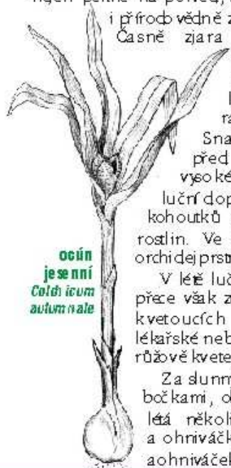
ocún je se nni Colchicum autumnale

Louky v Terezkém údolí jsou nejen pěkné na pohled, ale jsou i přirodovědně zajímavé. Časně zjara můžete narazit na porosty laďonky rakouské.